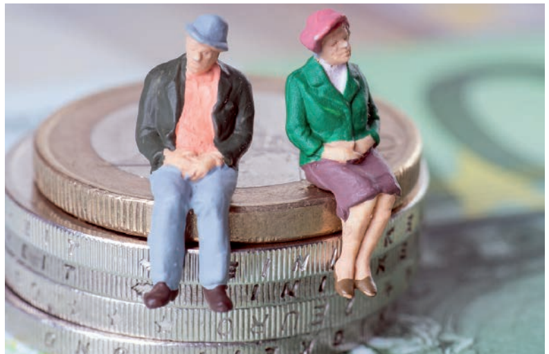
Verhoging AOW-leeftijd onder vuur

De 'Wet werken na de AOW-gerechtigde leeftijd' is per 1 januari 2016 in werking getreden. Met deze wet moet het voor werkgevers aantrekkelijker worden om werknemers na het bereiken van de AOW-gerechtigde leeftijd in dienst te nemen of te houden. Om dit te bereiken hebben senioren minder rechten dan nog niet AOW-gerechtigde collega's. Zo hoeft de werkgever het loon van een