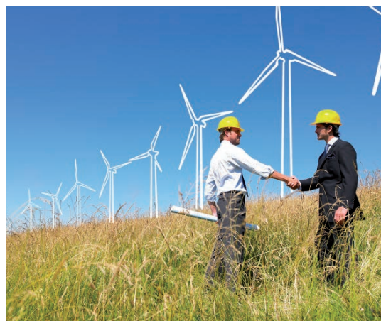
Milieulijst en Energielijst 2016: meer fiscaal voordeel

In veel bedrijven zijn er bestelauto's die aan de gezamenlijke werknemers ter beschikking staan. Omdat van die auto's wisselend gebruik wordt gemaakt kan het lastig zijn de regeling voor privégebruik individueel toe te passen. In zo'n geval dient de eindheffingsregeling toegepast te worden op het voordeel van het privégebruik. Omdat deze eindheffing voor rekening van de werkgever komt, betrekkelijk laag is en er in dat geval ook geen rittenregistratie bijgehouden hoeft te worden pakt deze regeling vaak gunstig uit. Als echter wel degelijk vast te stellen is welke werknemer de auto gebruikt mag de eindregeling echter niet toegepast worden. Dat bleek opnieuw bij een steigerbouwbedrijf, waarin de aanwezige auto's feitelijk slechts aan twee werk-