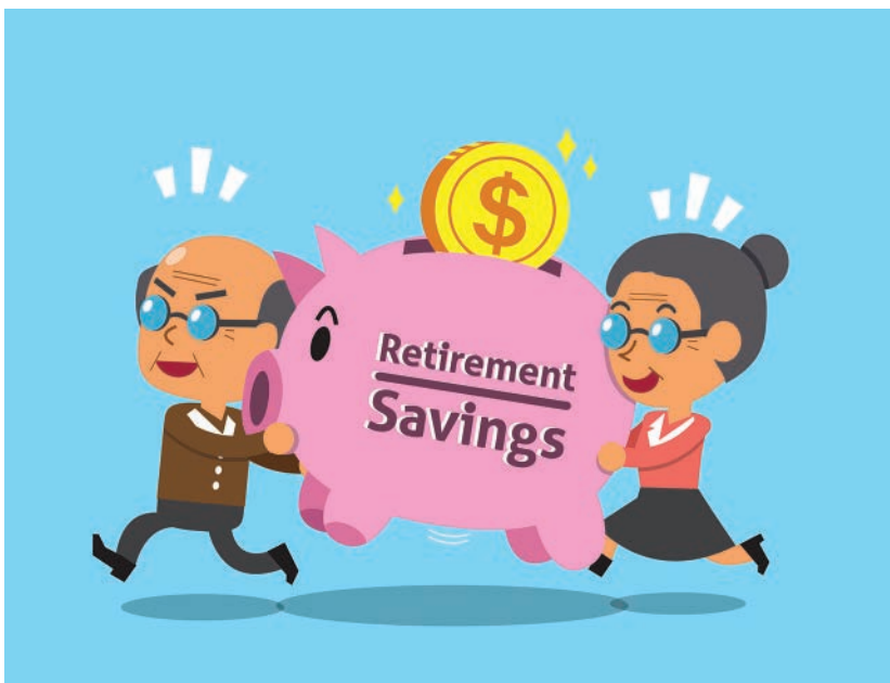
Nieuwe regels bij overhevelen pensioen

Ook verlies of diefstal van USB-stick, van een laptop, telefoon of zelfs papieren dossiers kan worden aangemerkt als een datalek.