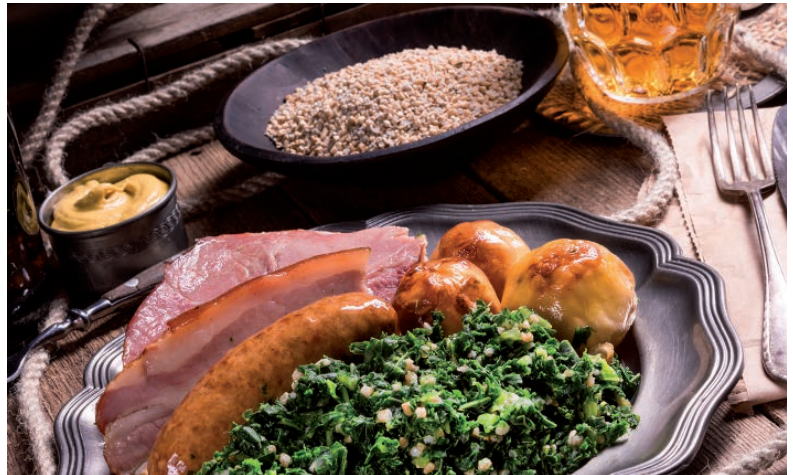
Normbedrag voor maaltijden verhoogd

Als de werkgever zijn werknemer(s) een gratis maaltijd aanbiedt (en er geen zakelijke redenen zijn om dat te doen, zoals overwerk) dat vormt die maaltijd loon. Vraag is dan hoe die maaltijd gewaardeerd moet worden. Om trammelant daarover te voorkomen kent de loonbelasting al